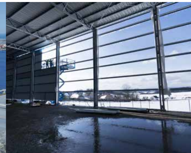
Preprava a montáž pomocou vlastných kapacít